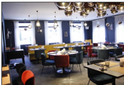
Un lieu chaleureux et raffiné

• La cascade insolite : 19 place du Général-de-gaule, au Vaudreuil. Tel : 02 32 25 97 41. Mail : contact@la-cascade-insolite.com , la-cascade-insolite.com . page Facebook.